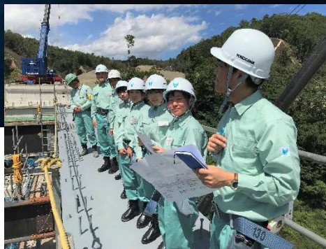
現場見学・橋梁見学