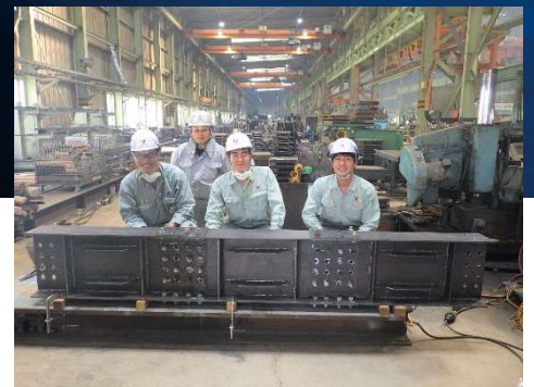
工場作業体験(切断・溶接など)